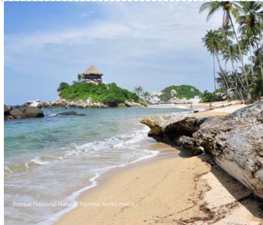
Parque Nacional Natural Tayrona, Santa marta